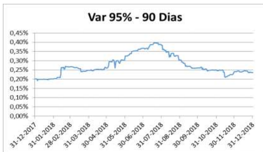
Máxima Pérdida Potencial Esperada Evolución del VaR (Serie más representativa)